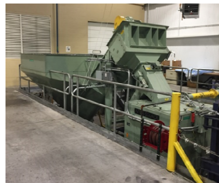
例) アルミスクラップシステム