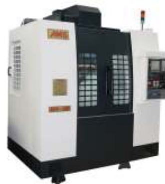
例)マシニングセンター