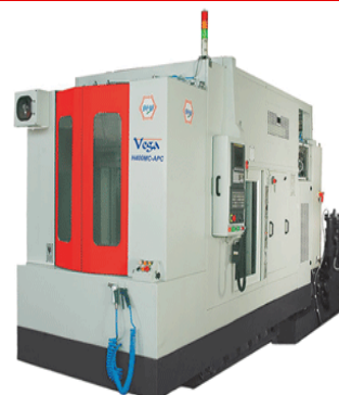
例)マシニングセンター