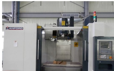
例)マシニングセンター